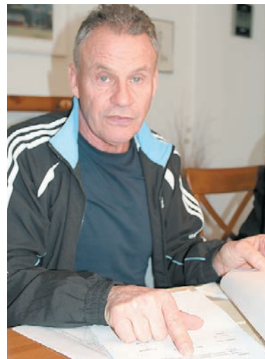
Schwarz auf weiß könne er beweisen, dass seine Vorfahren die rechtmäßigen Eigentümer gewesen seien, so Kuprian.

Tipp von CONNY HAAS / Idealtours Telfs: TANZMUSIK AUF BESTELLUNG Montegrotto Terme 17.-21.03. / 24.-28.03. inkl. Komfortbus, 3 Ausflüge, tägliches Tanz-Abendprogramm, Massage, Mittagessen am Abreisetag, Hotel Millepini**** 5 Tage 4x VP € 435,-