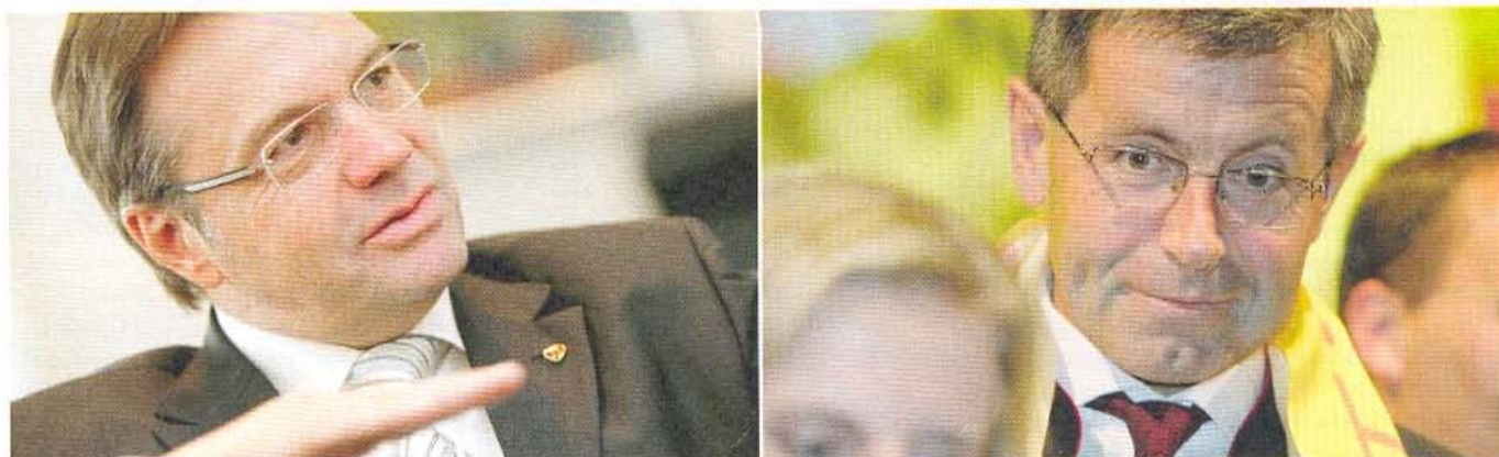
Entscheidung: Die Wahl des neuen Vorsitzenden des Landesagrarsenates wird zur Kraftprobe für LH Günther Platter und Bauernbundobmann Anton Steixner.

Hubert Sponring. Seine Agrargemeinschafts-Entscheidungen werden offen als verfassungs- sowie gesetzwidrig bezeichnet und die Bauern von Vent zeigen ihn bei der Staatsanwaltschaft an. Derart umstritten war noch kein Landesbeamter, doch Hubert Sponrings Tage als Vorsitzender des Landesagrarsenates scheinen gezählt.